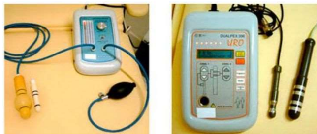
Figura - 4 Aparelho de eletroestimulação