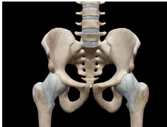
Figura -1 Pelve Óssea

A pelve óssea é composta por dois ossos, chamados ossos do quadril, que se ligam ao sacro. Cada grande osso é constituído de unidades ósseas são ílio, ísquio e púbis (Fig. 1). O ângulo formado entre os arcos púbicos é mais obtuso na pelve feminina. A abertura superior mais larga facilita o encaixe da cabeça do bebê e no parto. (PALMA, 2009 p 27)