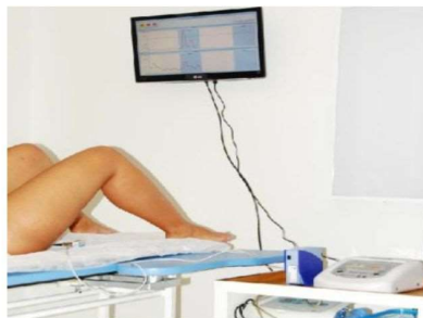
Figura -3 Biofeedback Eletromiográfico

É um equipamento utilizado onde através dos sinais visuais ou sonoros consegue fazer a leitura e verificar qual grupo muscular deve ser trabalhado e assim melhorar os efeitos dos exercícios perineais, aumento da percepção sensorial, recomposição da coordenação e do controle motor voluntário, ocorrendo na melhora funcional e nos sintomas da IU. (RETT, et al., 2007; VARELA, 2017)