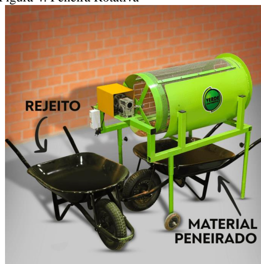
Figura 4: Peneira Rotativa