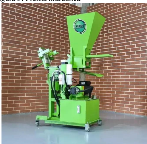
Figura 5: Prensa hidráulica