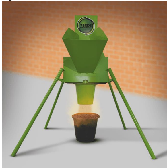
Figura 3: Triturador de Solo