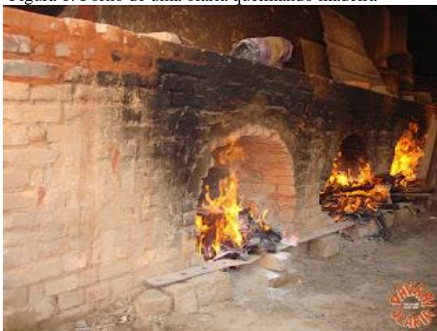
Figura 1: Forno de uma olaria queimando madeira