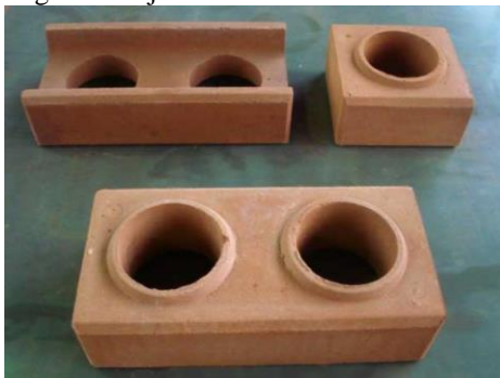
Figura 2: Tijolos de solo-cimento