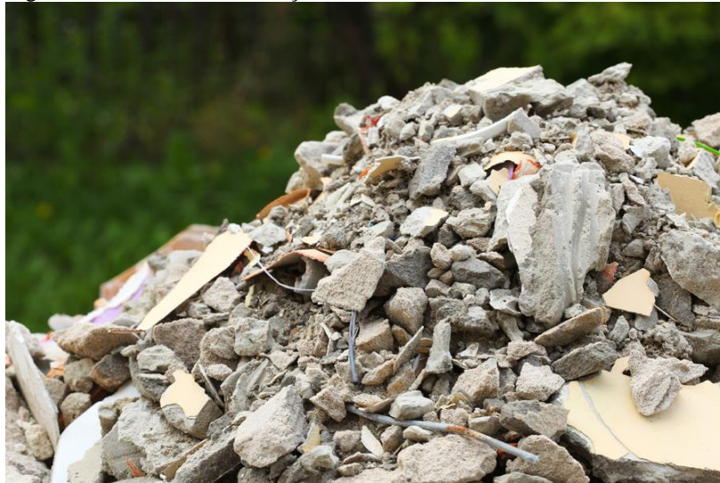
Figura 2: Resíduos de construção civil